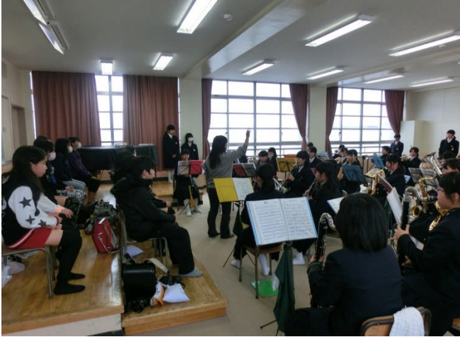
↑ 最多の部員数を誇る吹奏楽部 来年度も多数の入部が予想されます。男子部員来たれ！