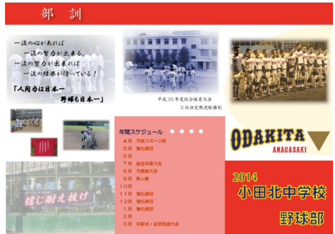
↑ 野球部父母会作成のパンフレット。支援体制は理想的です。現在、若草中と合同チーム編成中です。