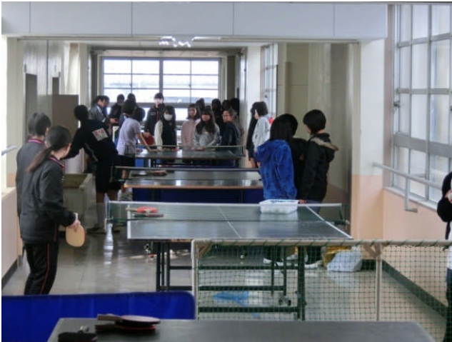
↑ 現1年部員不足のため新チームでは団体戦危機。伝統の保持を…新入生入部を期待しています！