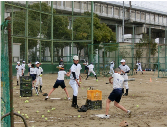
↑ 校内では練習時間最長部のため？部員少ない。学校外で野球する人、学校のクラブに入ろう！