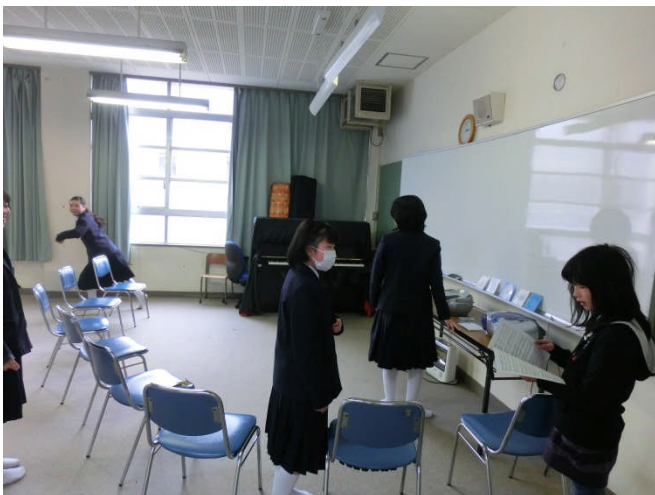
↑ 地域活動が活発な合唱部 歌好きな人集まれ！ 各種発表に向けて自分達で活動出来ます。