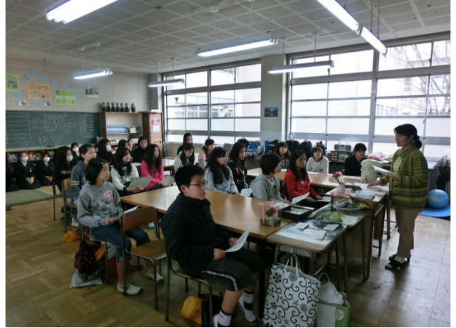
↑ 多数参加者のいた茶華道部。活動頻度や時間は限定されていますので入部しやすいですよ。