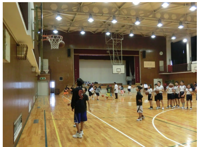
↑ 男子では人気の高いバスケットボール部。昨秋県大会出場。春・夏の大会での活躍が期待？