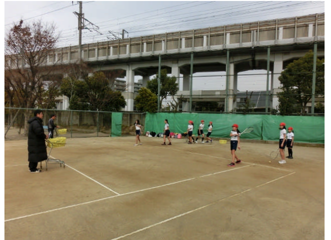
↑ 釣谷コーチも元気です。自主朝練を黙々と…テニスコート4面は市内随一の環境です。