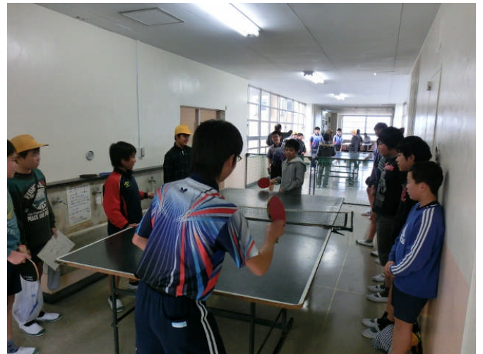
↑ 卓球王国の復活を目指す男子卓球部 新年度も、多数の入部がありそうです。