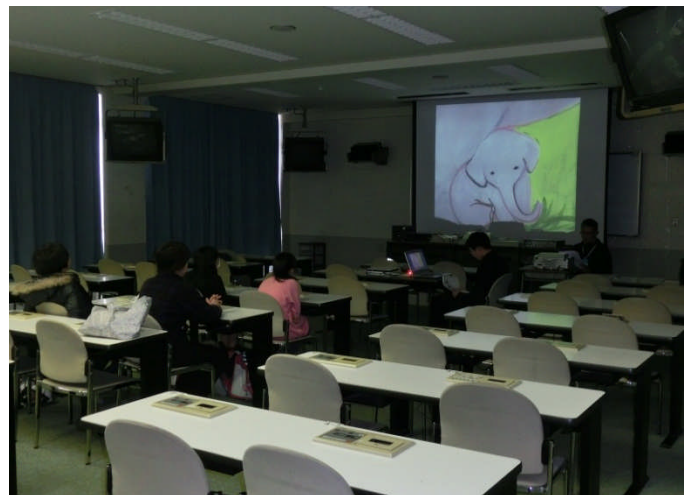
↑ 現在部員 1 名。興味のある人は是非、入部を… 総合文化祭・英語祭を目標に頑張ろう！