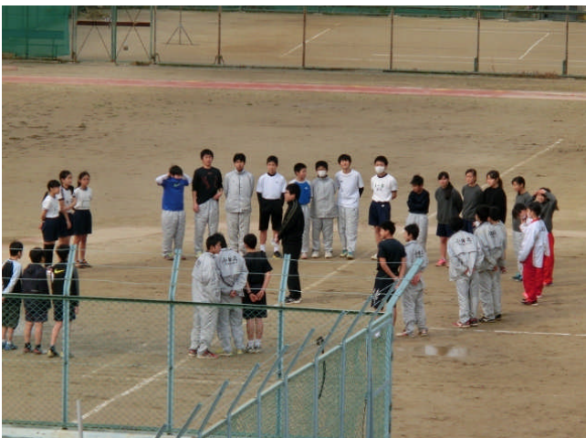
↑ 個人種目では、最適と思われる陸上競技部。短・長距離、跳躍、投てきなど特性が生かれます。