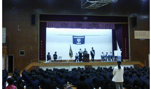
<立会・応援演説の様子>

12/3日より、短い間でしたが、朝から正門で生徒会役員選挙運動が繰り広げられ、6日に1学期に出来なかった生徒総会（活動報告会）も行い、その後新役員候補の立会演説会・投票が行われました。その結果、以下の通り新生徒会役員が決まりました。