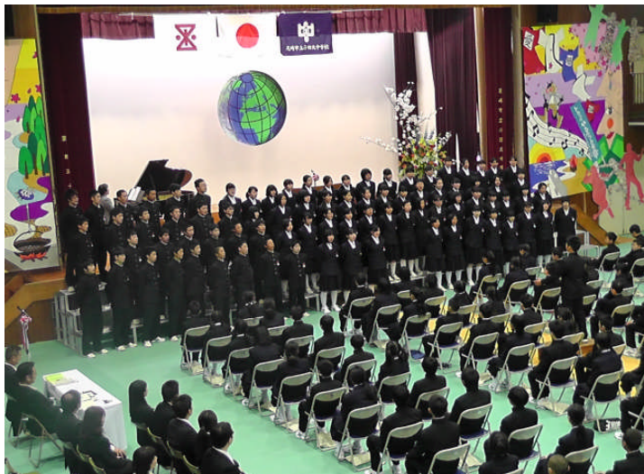
卒業した3年生作成壁画と歓迎の歌を歌った2・3年生