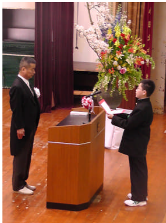
誓いのことば 少し緊張気味でしたが立派に

始業式・入学式から2週間経ちました。学校生活が本格的に始まっています。間もなく家庭訪問が始まり午前中の生活となり、5月の連休も控えています。生活のリズムを保つためにも、計画的で健全な日々を過ごして下さい。