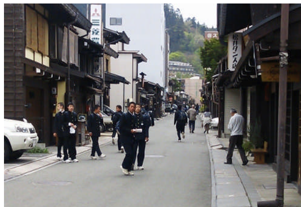
＜飛騨高山を思い思いに散策を楽しむ小田北生＞

1泊目に古民家“水道屋”と“満寿屋：先生部屋”で特別指導宿泊したり、細々と注意を受けた人もいました。(詳細は、学年通信「かけはし」参照して下さい。内容により、ご家庭の協力がなければ健全に育成出来ないと思われまますので、今後とも宜しくご協力をお願いします。)あれだけ繊細で熱心な指導しているのに「何でかな?!」とも思いますが…しかし、安全第1で熱を出す人もけがをする人もなく146名が、無事に帰校したことを始め、五箇条をしっかりと意識出来た人もたくさんいたと思います。忘れられない修学旅行となったことでしょう。このまとめりと自律・自治出来た経験を残りの中学生活でも、十二分に発揮して欲しいと思います。12月の希望進路決定が楽しみです。