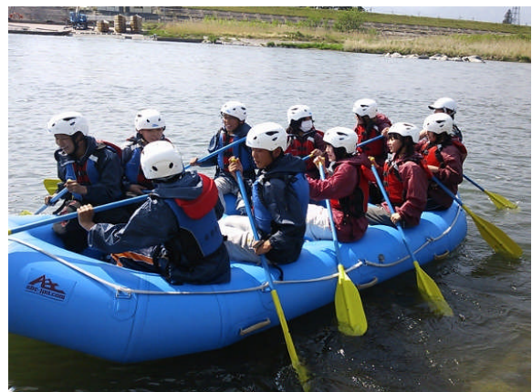
<最初は不安そうでしたが…爽快なラフティング>