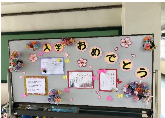
小学校の先生たちからの祝詞です。