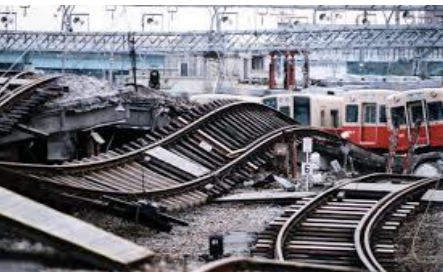
地震の衝撃で波打つ線路↓

左の写真は、国道43号線に横倒しとなった阪神高速神戸線です。この日学校へたどり着くことが出来た先生方と、校長室のテレビでこの映像を見たとき、愕然としました。