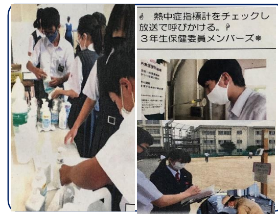
熱中症指標計をチェックし放送で呼びかける。P.3年生保健委員メンバー*