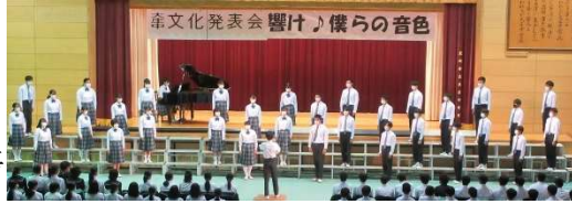
<3年生の合唱コンクール>

いました。また、舞台では、OEC、吹奏楽部も3年生引退の舞台。大きな拍手が起こっていました。代表クラスの合唱、少林寺、生徒会執行部、英語スピーチ、有志の発表など、体育館が一つになった時間でした。裏方の係の人も良く頑張った。力を合わせれば、素晴らしいものができる。大庄中の力を見せてくれた時間でした。