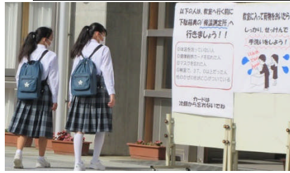
<登校風景と学活での話し合い>