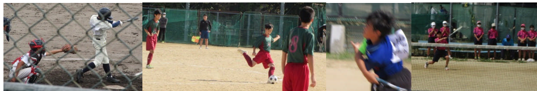
左から野球部・サッカー部 ソフトテニス部男子・女子

次に2つ目の先輩・後輩との共生～力を合わせよう～・中体連の全国大会につながる「尼崎市総体」。運動部に所属する3年生にとっての引退試合が6月19日(土)から右の表のようにおこなわれます。もちろん1試合でも多く試合ができることは大切ですが、それと同時にその日を迎えるまで校内でどんな練習をするかが大切。3年生にとって、1年生からコツコツ取り組んできた集大成。いい時もあれば、悪い時もあり、壁ができてつらくなった時、でも立ち向かっていく勇気も「行為」として示してきたと思います。今から引退までの短い時間を3年生同士で「こころ」「思い」の一番入った練習を大切にしてください。そして、1,2年生は、全力で練習することで先輩へ「こころ」「思い」を伝えてください。文化部の3年生は、10月の文化発表会が節目の時ですね。運動部と同じく、先輩・後輩と力を合わせるクラブ活動を期待しています。<上下12枚は、運動部新人戦等大会での写真です>