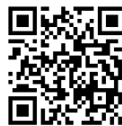
専用ホームページ