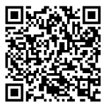
尼崎市ホームページ

また、地域クラブにおいては、尼崎市教育委員会（地域クラブ推進担当）が窓口となり、保護者、関係者への説明会や質問対応を行っています。詳細については、市のホームページで、取組方針などを掲載していますのでご覧ください。