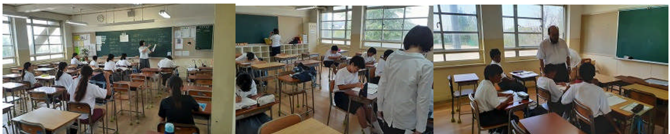
夏季休業中 1年生補習授業 トライ学習会の様子

8月26日(月)に始業式を行い、いよいよ二学期がスタートしました。夏季休業中は、部活動では、県大会に出場した生徒や近畿大会に出場した生徒が活躍してくれました。また、運動部は、新チームになり、気持ちも新たにいきいきと練習に励んでいました。また、各学年で実施された補習授業や学習会などに参加している生徒も多く、夏休みといっても北中生のよく頑張っている姿を見ることができました。この夏、それぞれが頑張ったことについて自分で自分をほめてあげましょう。