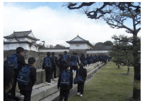
大阪城公園、大阪歴史博物館(2月8日)