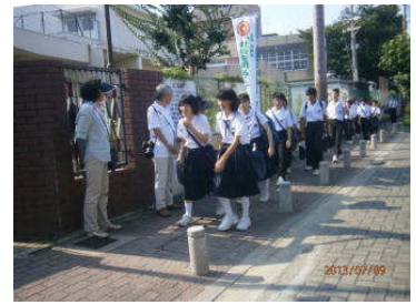
7/9 保護司会との交流

携帯電話は便利な反面、危険と隣り合わせの面があります。家庭内でルールを決める等、保護者の方の見守りが不可欠です。どうぞ、よろしくお願い申し上げます。