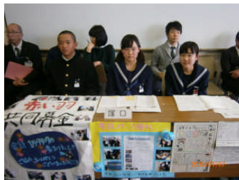
社会力育成事業指定校発表会 生徒会執行部役員が 塚口中の取組を発表 (1月 教育総合センター)