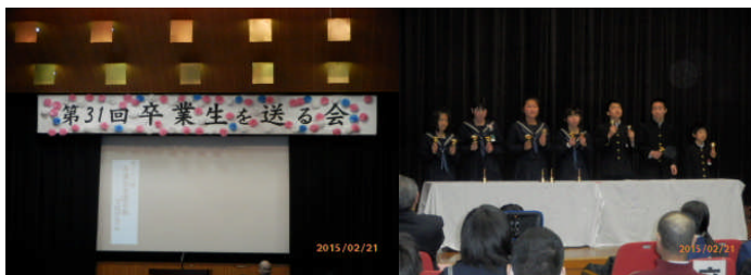
第31回 卒業生を送る会 「レット・イット・ゴー」 力を合わせたハンドベル演奏 (2月 教育総合センター)