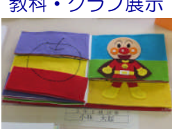
各展示は力作揃い