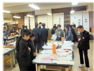
教科・クラブ展示

さて、午後は展示見学でした。茶道部のお茶会にも多くの方が訪れ、「和の心」を味わっていました。クラブ展示はどれもレベルが高く、教科の発表も力作揃い。改めて塚中生のパワーを感じた一日でした。