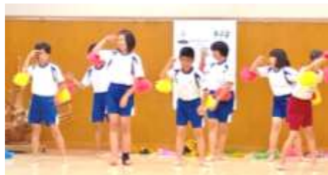
るり溪合同合宿 スタンツのダンス

人生80年、皆さんはまだスタートしたばかり。失敗や負けを繰り返しながら努力を続けると、良かったと思える日が必ずきます。毎日、お弁当を作り、体操服やユニホームを洗って応援してく