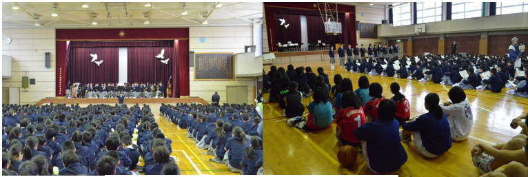
4月10日対面式・クラブ紹介 風景