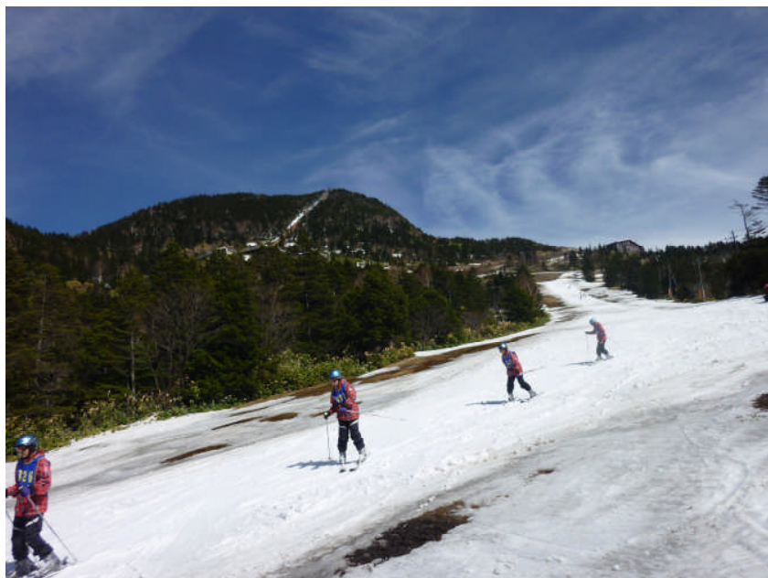
長野県志賀高原 雄大な大自然の中で・・・