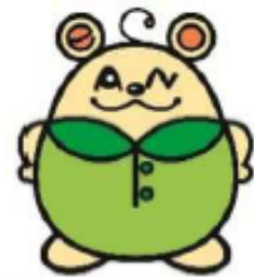
尼西キャラクター 「あまエッコ君」