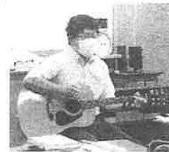
辰先生(数学)の飛び入り演奏!