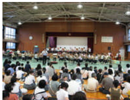
園田学園中・高校