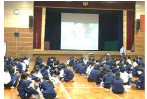
脱いじめ「スタンドバイ」研修(1年生)

先日、1年生を対象に「スタンドバイ」アプリの説明がありました。何か悩みがあれば、アプリを通して専門の相談員が対応をしてくれます。本校でも担任を中心にして、いじめアンケートや教育相談で生徒の皆さんの悩みや困っていることの相談にのっていますが、学校の先生にはちょっと…というようなことがあればぜひ利用ください。匿名で相談できます。2, 3年生も継続してアプリを利用できます。また、スクールカウンセラーも毎週火曜日に来られていますので合わせて利用してください。困ったとき、いつも誰かがあなたのそばにいますよ。