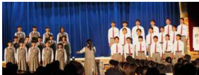
合唱 園田中代表 3-1

各クラスの合唱への熱い想いは今年も過熱気味! 各学年の合唱コンクールはレベルが高く、しかも聴いている人の心をふるわせる素晴らしいコンクールになりました。各クラブのステージ発表、教科・クラブの展示発表、どれをとっても、生徒が輝いていて、「生徒が主役」の「文化の秋」を披露、その中でも3年生は、合唱で他学年を圧倒、その他の発表でも、最高学年の実力と気迫を見せつけました。また、運営面においても、縁の下の力持ちが見えないところで活躍!!3年生が主役中の主役を演じ切りました。これを見た1.2年生が来年度はさらに素晴らしいものを創ってくれると確信しました。