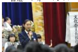
文化委員長あいさつ