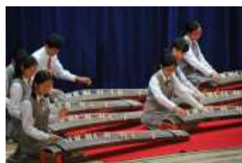
邦楽 さくらメドレー

特に3年生にとっては、人生の岐路の選択を控えてとても大切な時期!秋の夜長をしっかりと勉強しましょう。ゲームやライン等はしばらくの間封印することも必要!!