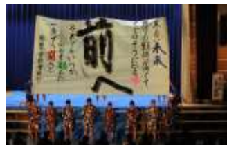
書道パフォーマンス