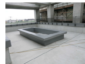
屋上緑化用設備 足湯ではありません