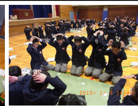
特別ルール 手は頭の上

3年生 球技大会 12月15日 男子 バレーボール 優勝 3年7組 女子 ドッジボール 優勝 3年4組