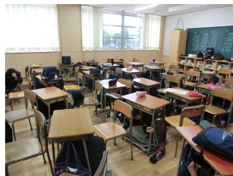
無人の教室ではありません 地震から身を守るため 全員机の下に入っています