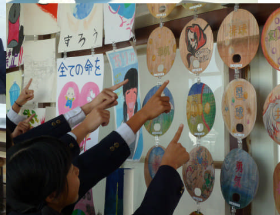
美術科、美術の授業で頑張りました。