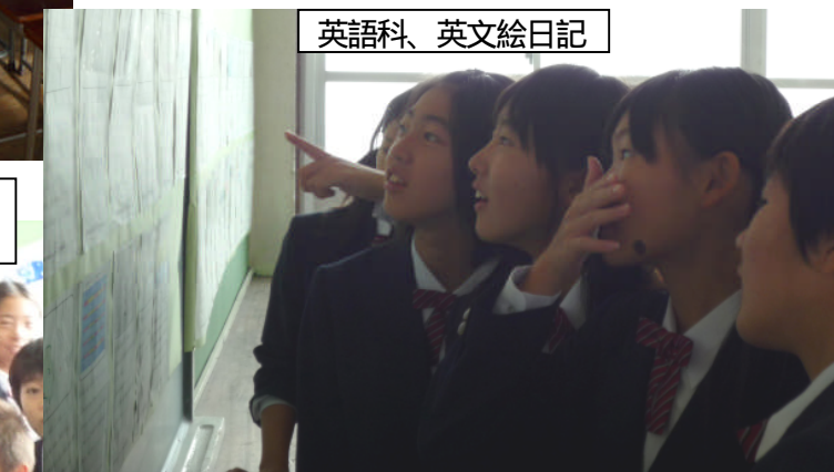
英語科、英文絵日記