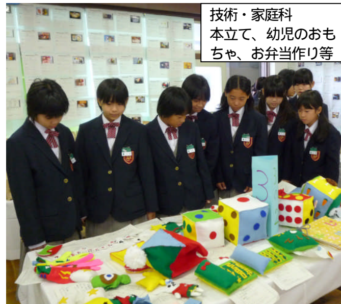
技術・家庭科 本立て、幼児のおもちゃ、お弁当作り等

合唱コンクールでさらに強まったクラスや学年の絆や一人一人の輝きをこれからの学校生活に活かし、学習やクラブ活動で自分の可能性にチャレンジすることを期待しています。