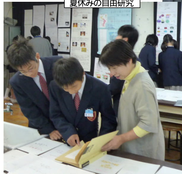
理科 夏休みの自由研究