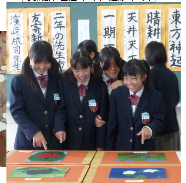
美術部、書道コース・造形コース