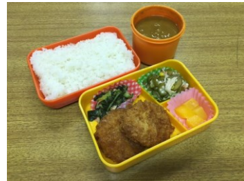
人気No. 1に輝いたチキンカツカレー

5日間の販売数は89個(前日45個、当日44個)と、いつもの4~5倍ほどの売り上げ…当日分も週の後半になると増えていきました。やはり、当日販売があったほうが利用しやすいということが園田中では証明されました。この結果は、他の2校の結果と合わせて検討されます。最高売り上げは、木曜日のチキンカツカレーで、24個でした。