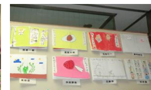
↑手作り絵本 ←合同作品(ツリー)

楽しい子育て全国キャンペーン 親子で話そう 家族のきずな わが家のルール 命の大切さ 三行詩