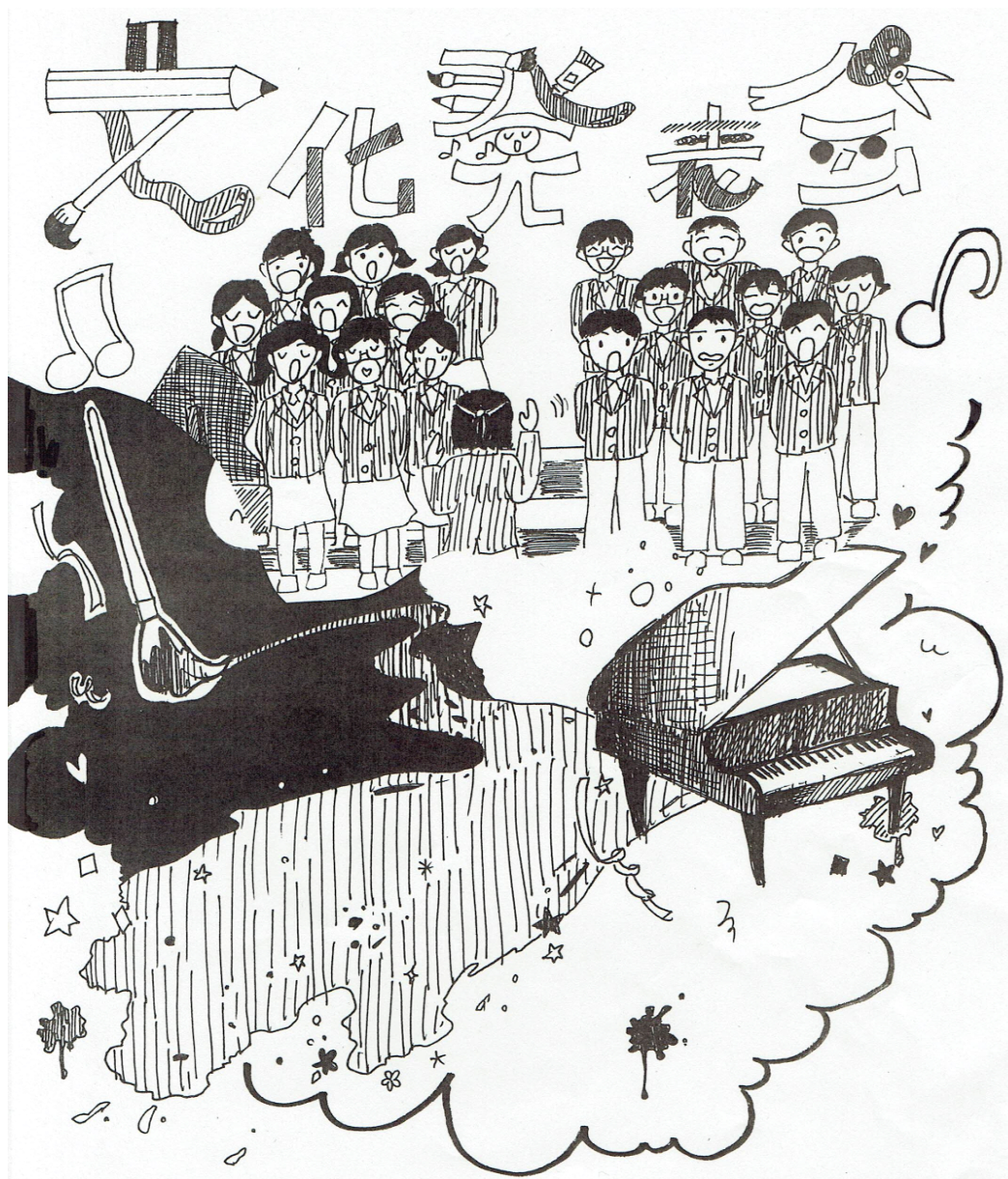
表紙絵 3-2 水本 美唯 3-4 松下 樹