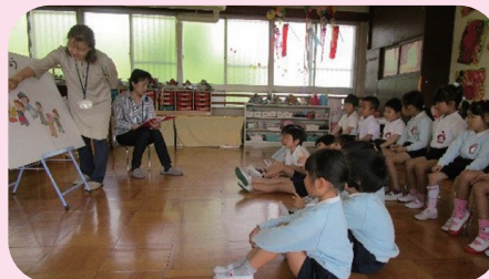
尼崎「子どもと本をつなぐ会」 によるパネルシアター