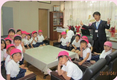
長洲小学校校長室にいったよ！