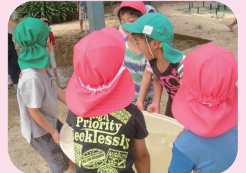
南杭瀬保育所のお友達と 泥んこ遊びをしたよ！