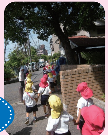
長洲公園に散歩にいったよ！