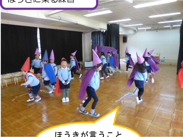
魔法学校 1時間目 ほうきに乗る練習