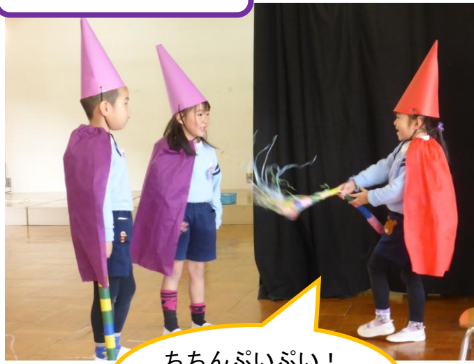
魔法学校 2時間目 変身の魔法の練習