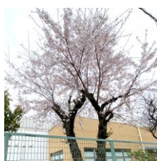
あまよう北西の桜

です。今年度の訪問学級在籍児童生徒は、小学部1年生2名、2年生1名、3年生1名、5年生1名の計5名と中学部1年生1名となり、教員が自宅にお伺いして学習を行います。67名全ての子どもたちを中心に据えて、保護者の皆様としっかり連携を図りながら、お子さんの成長を支えていきたいと思っております。減少したとはいえ、新型コロナウイルス等の感染症の心配は続きますが、感染対策をとりながら教育活動を進めてまいりますので、ご家庭でもご注意いただきますようお願いいたします。