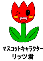
マスコットキャラクター リッツ君

令和6(2024)年4月8日 尼崎市立あまよう特別支援学校 あかるく まえをむいて よろこび うまれる No. 1