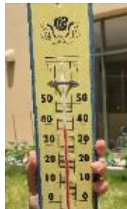
6月8日の中庭。 40度近い気温にビックリ!!