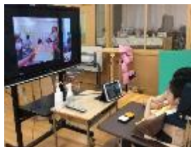
オンラインでの 居住地校交流