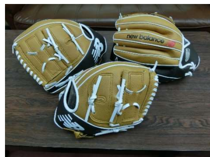
大谷翔平選手のグローブ①