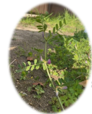
校庭の カラスノエンドウ

この目標は、教育の不易の目標として、立花南小学校に受け継がれています。社会が大きく変化する中でも、変えてはならないもの・変えなければならないものをそれぞれ見極めながら、教職員一丸となってお子様の教育に邁進してまいります。