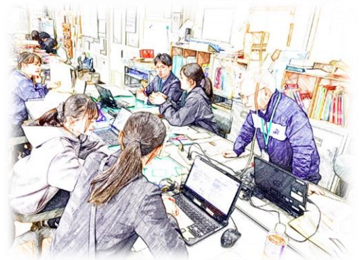
どんな先生でありたいか会議の様子

こんな言葉が聞こえてきました。 「ちょっとまって。もう一回言ってくれる？」 トリプレイを依頼し、録音か録画して記録にとっておきたくなるくらいです。 新学期が始まって、一週間。 『勉強が楽しい』そんな気持ちにさせた先生って凄腕です。 なかなか、めったと聞けない言葉です。