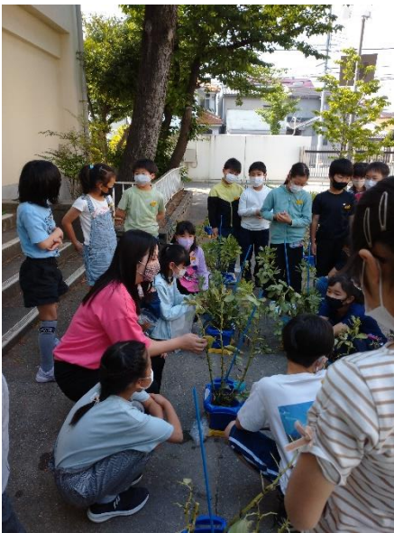
収穫できた富松一寸豆