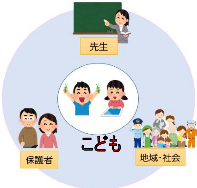
こどもセンターの視点

こどもを真ん中において、こどもの最大限の成長につながるよう、教職員・保護者・地域社会が協力しサポートします。