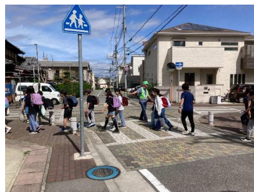
地区別集団下校のようす

5月22日（金）には「地区別集団下校」を行いました。警報発令時等に安全に各家庭まで下校するための訓練です。地区別の5グループで先生引率の元、通学路の確認を行いながら下校しました。当日は、学校運営協議会、PTA、園田地域課、地域の皆様に下校時の見守りへのご協力をいただきました。今後も地域・保護者の皆様と学校が協力しながら、子どもたちの安全を守っていききたいと思います。ありがとうございました。